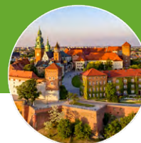
Urząd Miasta Krakowa

nia najmłodszego, ponieważ to ona przynosi stałe i długoterminowe efekty. W Krakowie działa ponad 20 ogrodów społecznych, które stając się oazami miejskiej bioróżnorodności, zraszają ludzi świadomych ekologicznie i zaangażowanych społecznie. W ramach projektu Ogród z klasą krakowskie szkoły zamieniają zwykłe podwórka w przyszkolne ogrody, a adepci Szkoły Miejskich Ogródników zazieleniają swoje podwórka i balkony. Stałe działania prowadzą m.in. takie miejskie podmioty jak Centrum Edukacji Ekologicznej Symbioza Zarządu Zieleni Miejskiej czy Centrum Edukacji Klimatycznej. Sukces działań to w dużej mierze ich uzupełniająca się wielopłaszczyznowość, którą Kraków stara się realizować w codziennych działaniach.